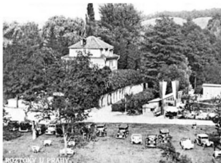
Maxmiliánka - dobová pohlednice