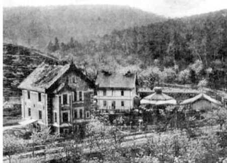
Maxmiliánka - restaurace s koupalištěm